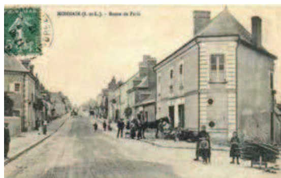
La rue Nationale, en venant de Paris, est particulièrement animée au début du XX e siècle. Le maréchal-ferrant est en pleine activité, le temps des autos n'est pas encore venu.

(...) La RN 10 poursuit son chemin vers le sud pour atteindre la petite ville de Monnaie (km 216). La route traverse entièrement la commune et reste aujourd'hui encore très fréquentée. Les riverains demandent une déviation depuis des années, ils ont obtenu pour le moment l'interdiction de la traversée de la commune par les poids-lourds.